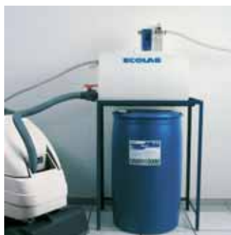
Maxi QuikFill 100